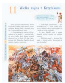
Tomasz Malinowski, Historia i społeczeństwo. Podręcznik dla klasy IV szkoły podstawowej. Gdańsk : Gdańskie Wydawnictwo, 1991, S. 82.

Aber auch heutige polnische Schulbücher sind nicht frei von problematischen Begriffen und Darstellungen. Współczesne polskie podręczniki szkolne nie są jednak wolne od budzących zastrzeżenia pojęć i sposobów przedstawiania treści.