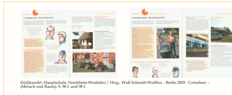
Er(d)kunde! Hauptschule, Nordrhein-Westfalen / Hrsg.: Wolf Schmidt-Wulffens. - Berlin 2003 : Cornelsen. - (Mensch und Raum), S. 96 f. und 98 f.

Polskie i niemieckie podręczniki do geografii i historii uległy poważnym zmianom w przeciągu ostatnich lat i dziesięcioleci. W podręcznikach niemieckich Polska zajmuje o wiele więcej miejsca niż dawniej. Uczniowie dowiadują się, że Polska tak w historii, jak i w teraźniejszości związana była i jest w sposób szczególny z historią Niemiec.