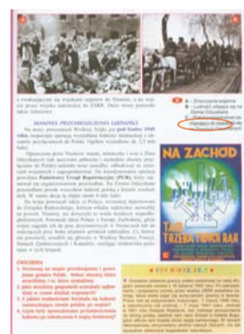
J.P. Trzeciak, Historia 3 gimnazjum. - Wrocław : Wydawnictwo, Wąsary, 1995, S. 136.

Der Begriff „Wiedergewonnene Gebiete“ bezeichnete im sozialistischen Polen die Gebiete, die Polen nach dem Zweiten Weltkrieg im Westen erhalten hatte. Er nahm Bezug auf deren Zugehörigkeit zum polnischen Staatesreich vom 10. bis 13. Jahrhundert. Damit war diese Argumentation genauso ideologisch wie die der Nationalsozialisten, die ihre Ansprüche mit der langen germanischen Besiedlung begründet hatten. In der Schulbuchkommission wurde der Begriff nicht verwendet.