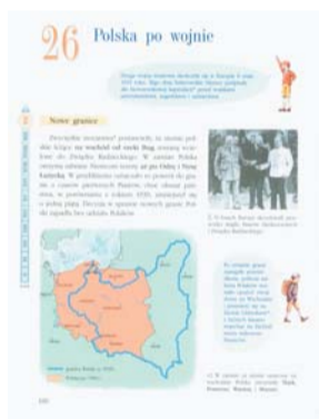
Tomasz Malinowski, Historia i społeczeństwo. Podręcznik dla klasy IV szkoły podstawowej. Gdańsk : Gdańskie Wydawnictwo, 1991, S. 100.

Der Deutsche Orden wird häufig vor allem in schlechtem Licht gerückt. Zakon Krzyżacki przedstawiany jest często w negatywnym świetle.