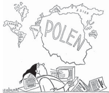
„Unser neues Weltbild“ „Nasz nowy obraz świata“

DE Im Sommer 1980 entstand aus einer Streikbewegung die Gewerkschaft „Solidarność“, die für politische und soziale Reformen in Polen eintrat. Mit der Ausrufung des Kriegszustandes am 13. Dezember 1981 durch General Jaruzelski wurde „Solidarność“ verboten und ihre führenden Mitglieder wurden interniert. Der Kriegszustand war auch für die deutsch-polnische Schulbuchkommission eine Zäsur. Die Kommunikation aufrechtzuerhalten war in dieser Zeit sehr schwierig. Und es war unklar, ob und wie es mit der Kommission weitergehen würde.